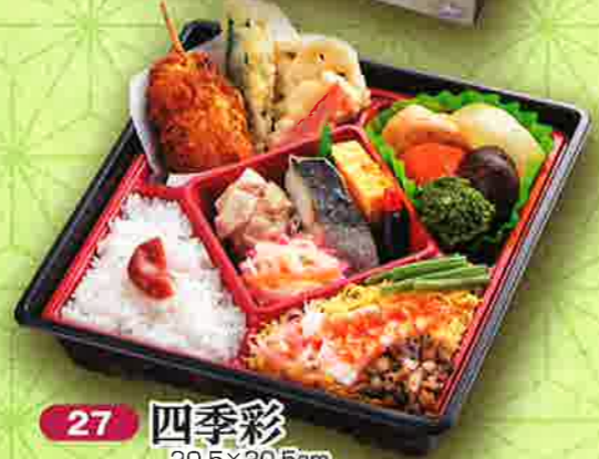
27 四季彩 20.5×20.5cm