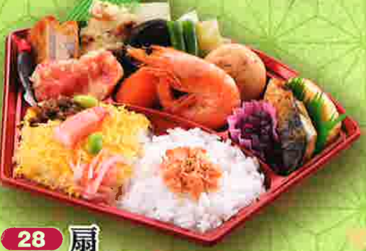
28 扇 24×13cm