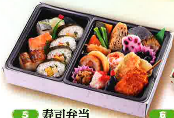
5 寿司弁当 28×19cm