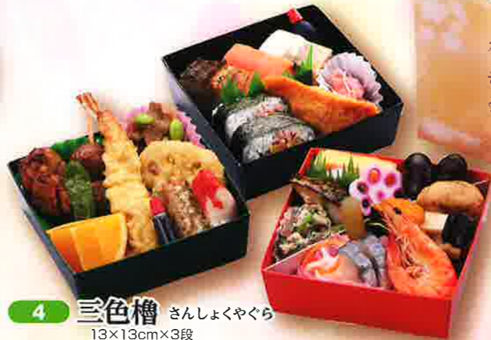
4 三色槽 さんしょくやくら 13×13cm×3段