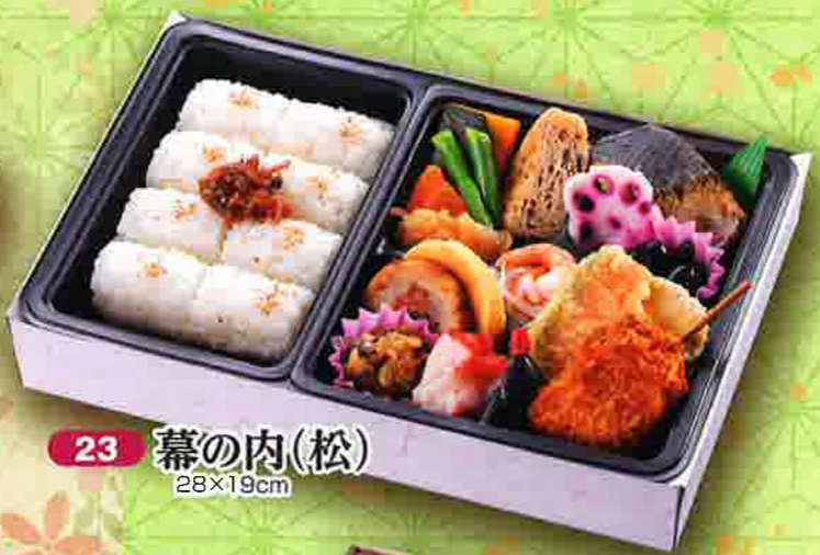
23 幕の内(松) 28×19cm