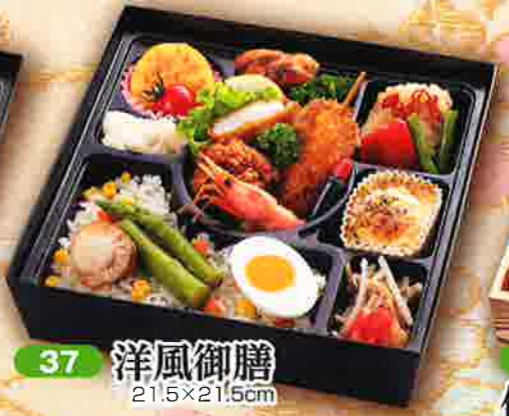
37 洋風御膳 21.5×21.5cm