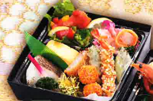
34 和洋二段 幕の内 風月 [上段] 22.6×22.6cm [下段] 21.1×21.1cm [二重高さ] 9.3cm