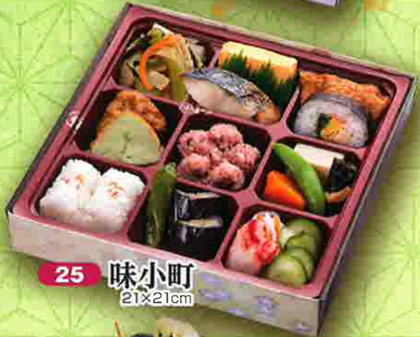
25 味小町 21×21cm