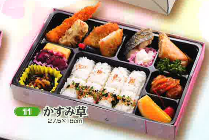
11 かすみ草 27.5×18cm