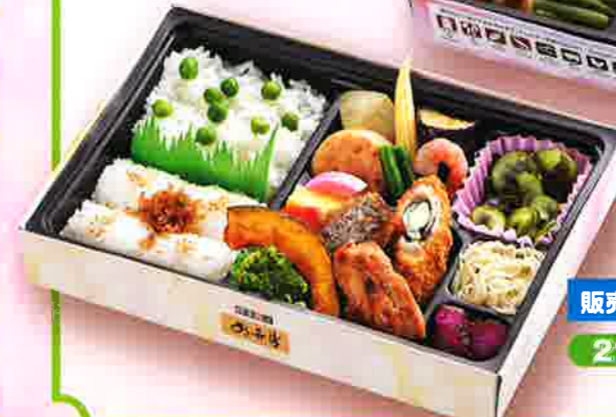
販売期間/6月~8月 21 夏膳 24×16.5cm