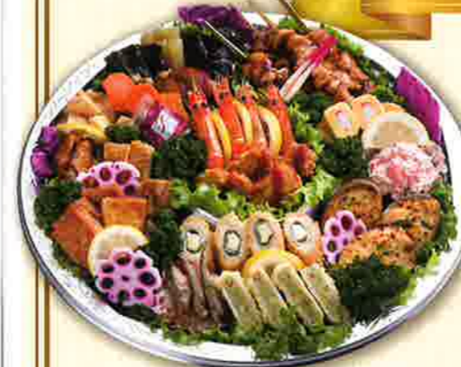
45 和風オードブル 直径40cm(5~7名盛)