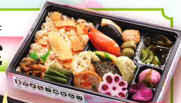
販売期間/3月~5月 20 春膳 24×16.5cm