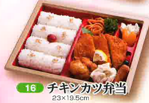
16 チキンカツ弁当 23×19.5cm