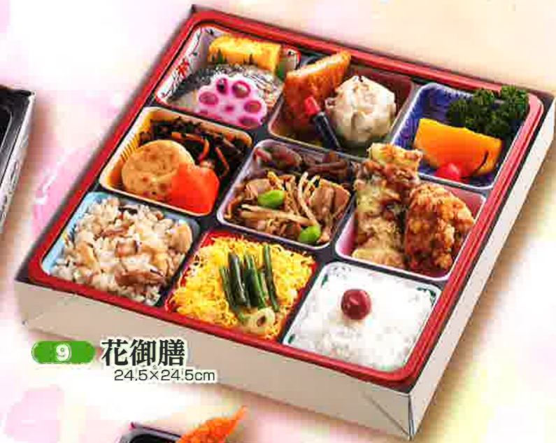
9 花御膳 24.5×24.5cm