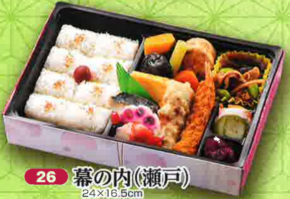
26 幕の内(瀬戸) 24×16.5cm