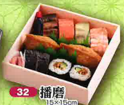
32 播磨 15×15cm