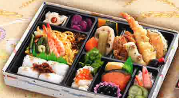
39 和洋幕の内弁当 29×20cm