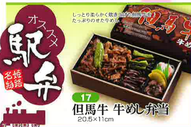
17 但馬牛 牛めし弁当 20.5×11cm