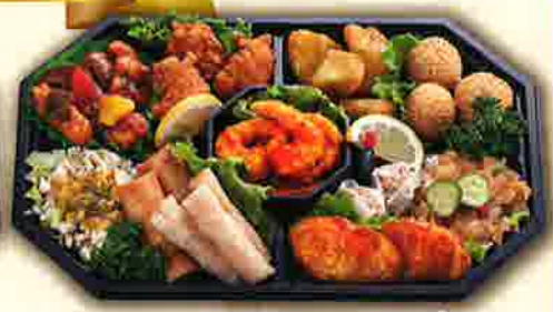
50 中華オードブル 36x24cm