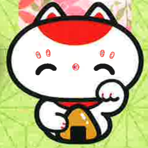
マスコットキャラクター「まねハチ」