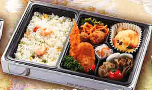
43 洋風ピラフ弁当 27.5×18cm