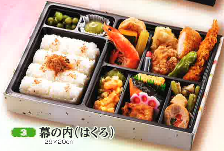
3 幕の内(はくろ) 29×20cm