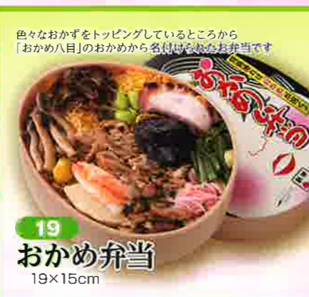
19 おかめ弁当 19×15cm