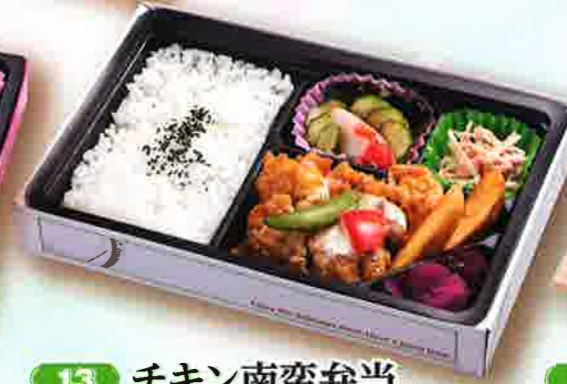
13 チキン南蛮弁当 24×16.5cm