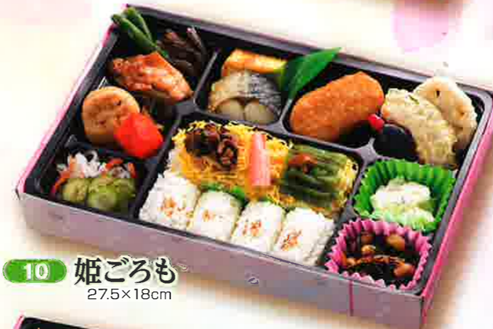
10 姫ごろも 27.5×18cm