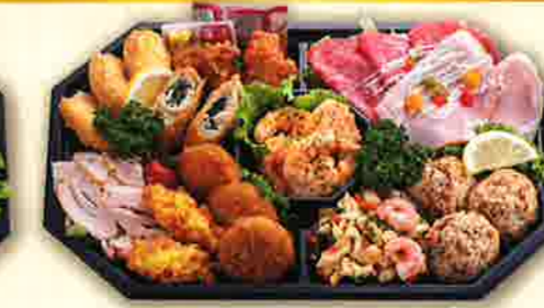
49 洋風オードブル 36x24cm