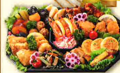
48 和風オードブル 36x24cm