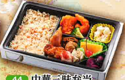
44 中華三味弁当 27.5×18cm