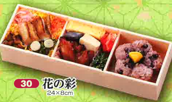
30 花の彩 24×8cm