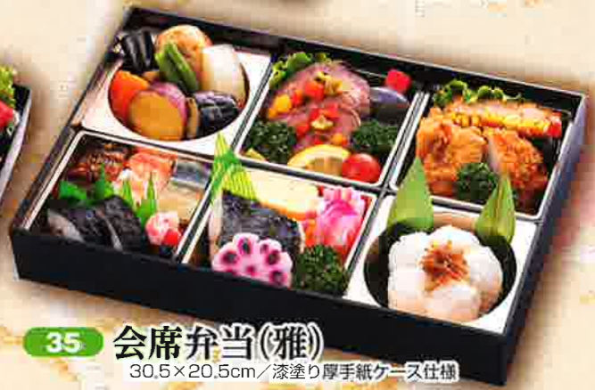
35 会席弁当(雅) 30.5×20.5cm/漆塗り厚手紙ケース仕様