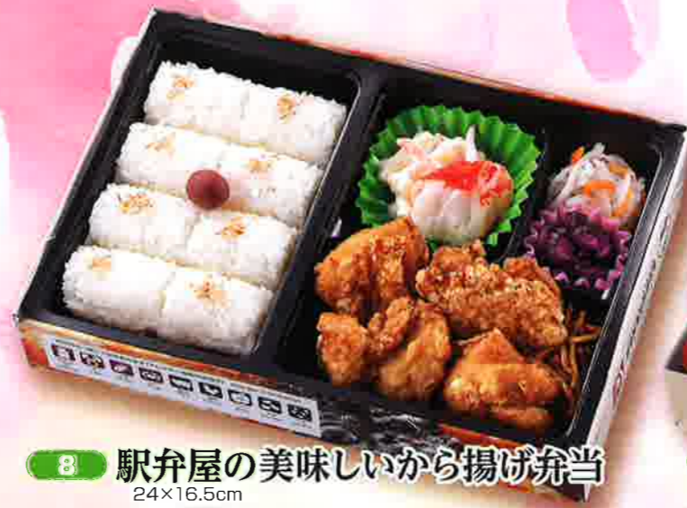
8 駅弁屋の美味しいから揚げ弁当 24×16.5cm