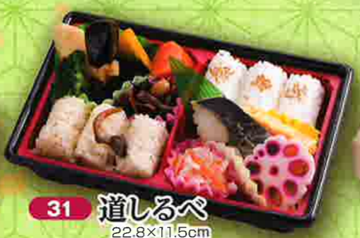
31 道しるべ 22.8×11.5cm