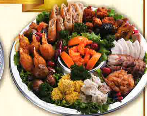
47 中華オードブル 直径40cm(5~7名盛)