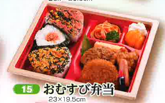
15 おむすび弁当 23×19.5cm