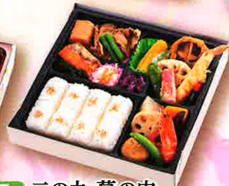
7 二の丸 幕の内 24.5×24.5cm