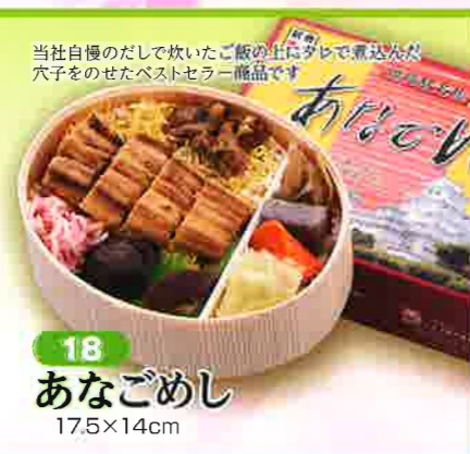
18 あなごめし 17.5×14cm