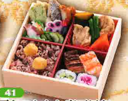
41 栗おこわとお寿司目和 16.5×16.5cm