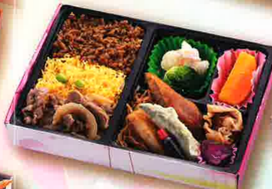
12 肉めし三色弁当 24×16.5cm