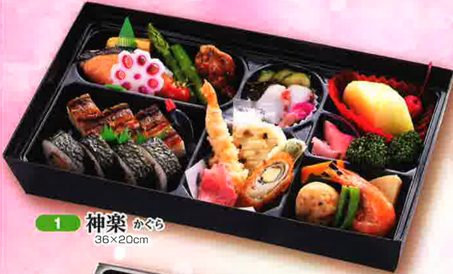
1 神楽 かぐら 36×20cm