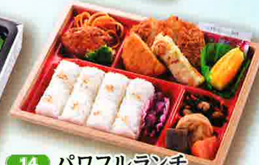
14 パワフルランチ 26.7×20.6cm