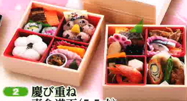
2 慶び重ね 喜食満面 (5.5寸) きしよくまんめん 16.5×16.5cm×2段