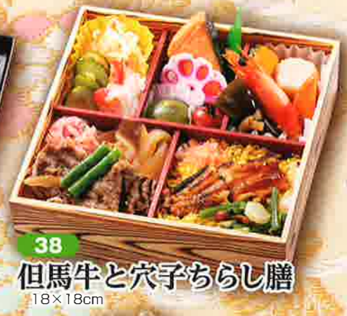
38 但馬牛と穴子ちらし膳 18×18cm