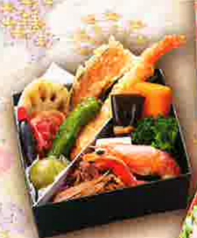
33 やぐら会席 13×13cm×3段