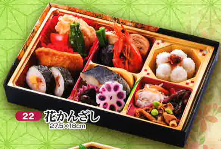
22 花かんざし 27.5×18cm