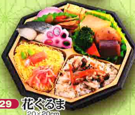
29 花ぐるま 20×20cm