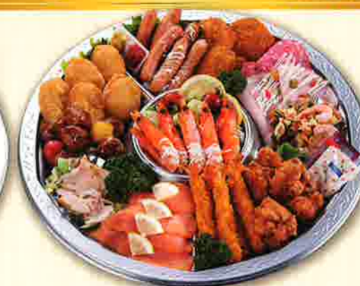
46 洋風オードブル 直径40cm(5~7名盛)