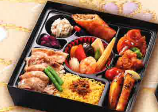
36 中華餡かけ御膳 21.5×21.5cm