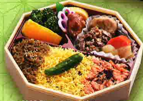
24 銀鮭ほぐし飯と但馬牛の味くらべ 18.5×18.5cm