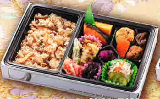
42 かやくご飯と銀鮭の幕の内弁当 27.5×18cm